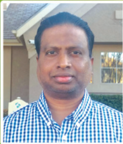
Srinivasa Battula Cultural & Event Management