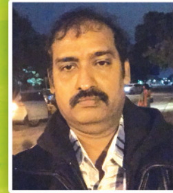
Kedarnath Mundluru Logistics & Food